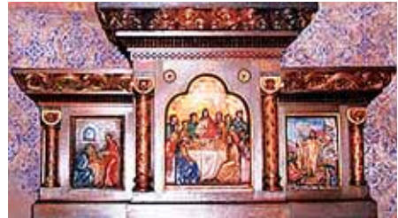
Der Grünauer Altaraufsatz

kirche), im Berliner Umland (Martin-Lutherkirche Fürstenwalde, Süd, Dorfkirche Gröben) und im Hannoveranischen (Weserbergland) (Lutherkirche Holzminden, Lutherkirche Harzburg, Brüdernkirche Braunschweig, Liebfrauenkapelle Bodenwerder-Linse). In seinen Darstellungen verbindet Wilhelm Sagebiel Geschehnisse des Alten Testaments mit denen des Neuen Testaments. Zu den Hauptmotiven des Bildhauers zählen das Abendmahl, die Kreuzigungsgruppe, die Evangelisten und der seine Jungen fütternde Pelikan. Eingebettet sind seine Themen in Ornamentik und stilisierten Pflanzen wie Ähren und Trauben.