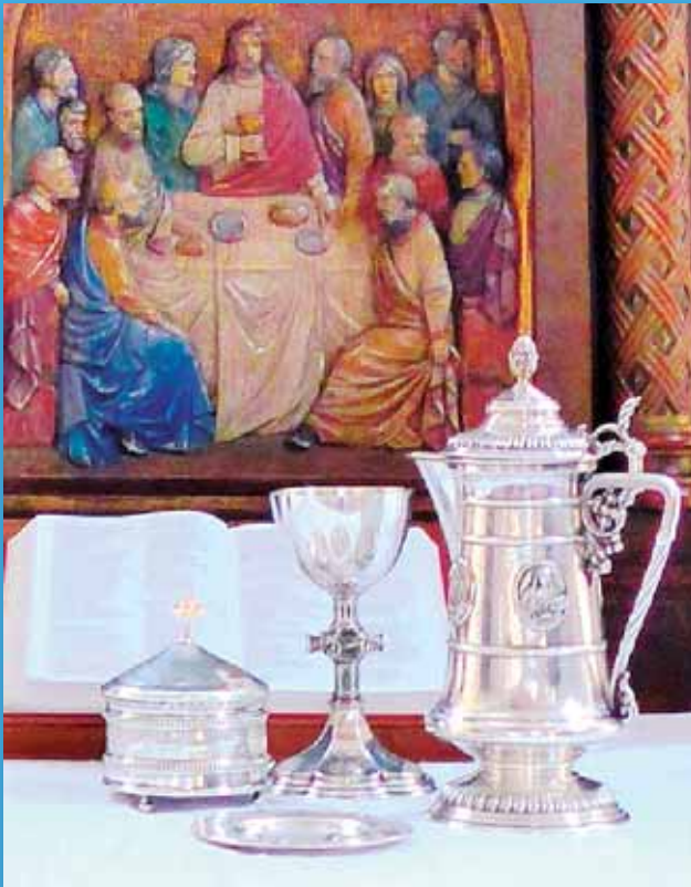
Abendmahlgeschirr der Friedenskirche Grünau Zum Tag des offenen Denkmals 8. September 2018 „Entdecken, was uns verbindet“